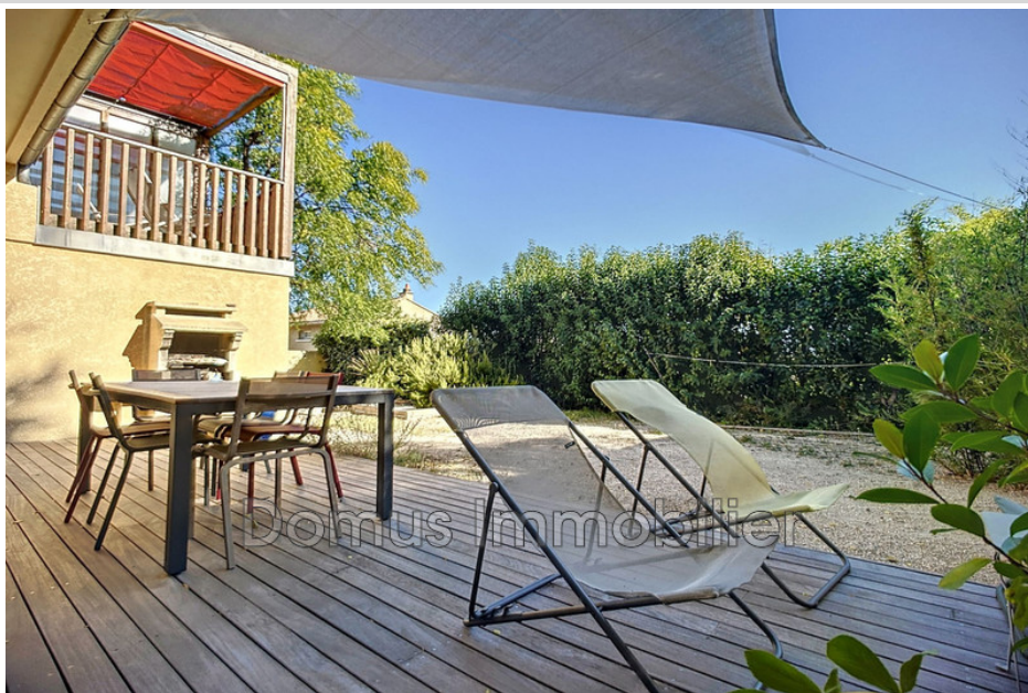
House 4605 Saint-Saturnin-lès-Avignon